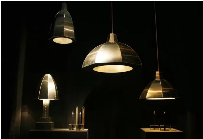
▲ Uit de serie Cut and Paste van Kiki van Eijk;De stalen lampen en kandelaars van Joost van Bleiswijk.