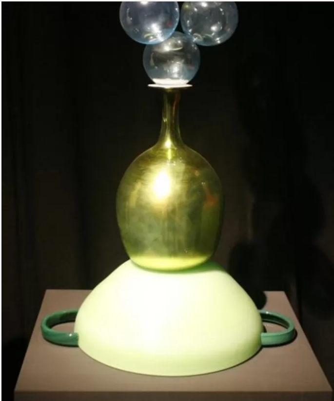
▲ Uit de serie Cut and Paste van Kiki van Eijkfoto's Irene Wouters ;De stalen lampen en kandelaars van Joost van Bleiswijk.

Mijn GemeenteOpiniePSVASMLPhilipsGeldAutoWonenGezondAchter de Schermen